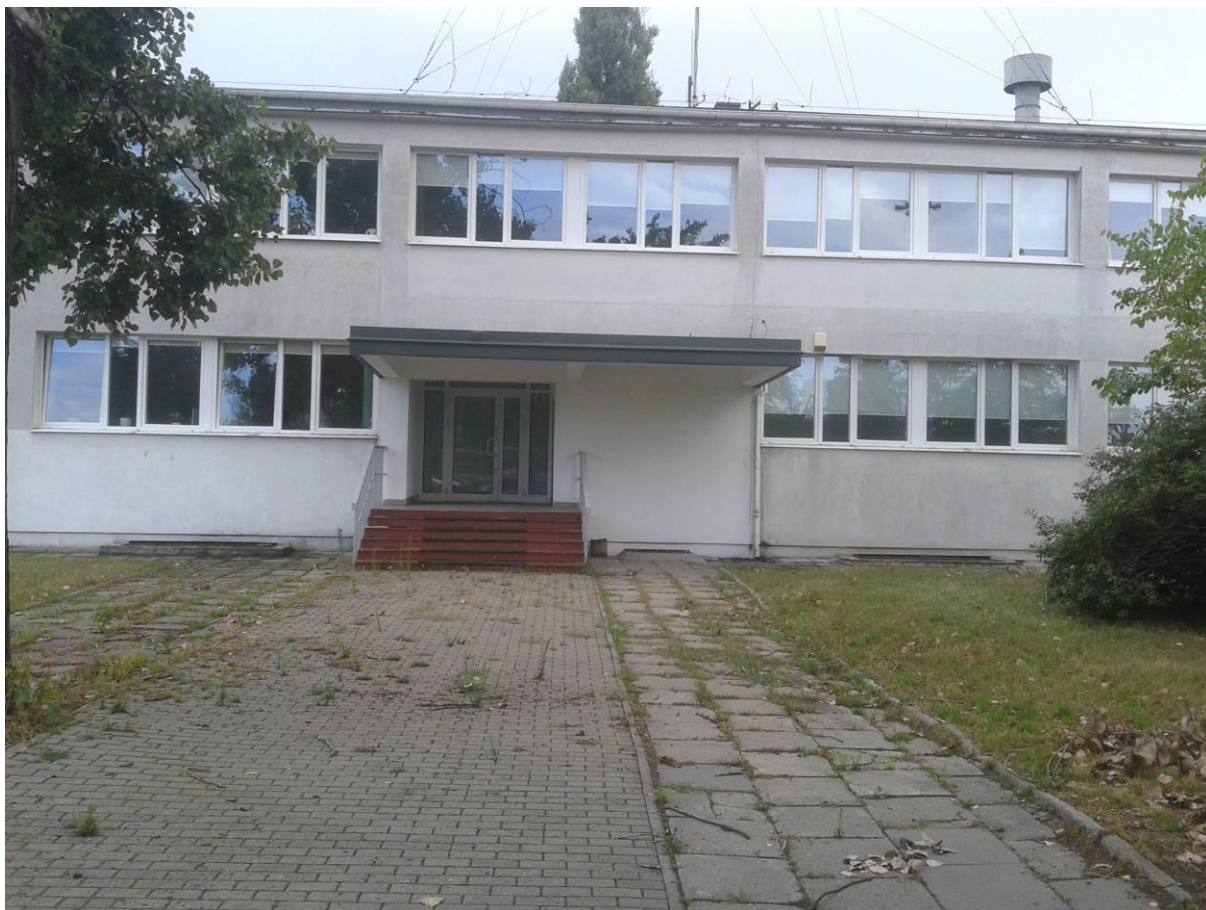
Wejście od zewnątrz