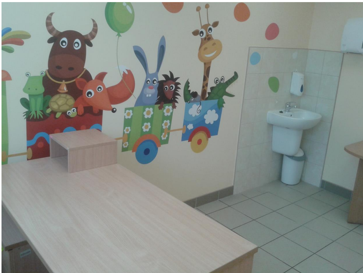
Gabinet lekarski (pediatryczny)