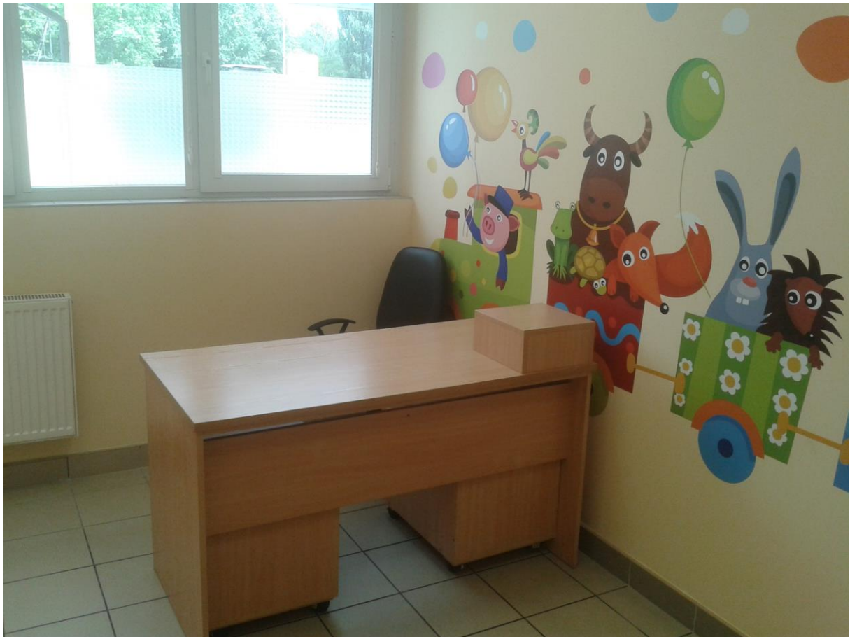
Gabinet lekarski (pediatryczny)